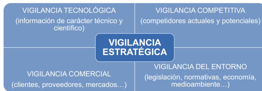
Figura 1. Sistema de vigilancia estratégica.

Sin embargo nosotros creemos en un sistema de vigilancia más amplio que comprenda además de los avances del estado de la técnica (vigilancia tecnológica), un análisis de los competidores actuales y potenciales (vigilancia competitiva), un análisis de nuestros clientes, proveedores y mercados (vigilancia comercial) y del conjunto de aspectos que configuran el marco de actuación de la empresa como la legislación, el medioambiente o la economía (vigilancia del entorno). Por lo tanto, el sistema de vigilancia a su vez debe integrar: