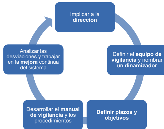
Figura 3. Integración del sistema de vigilancia.

No saber lo que está ocurriendo fuera nos da “felicidad” en el corto plazo, puesto que nos evita retos a superar, decisiones difíciles y situación complicadas con las que lidiar, pero en cualquier caso esa felicidad se verá diluida más pronto que tarde.