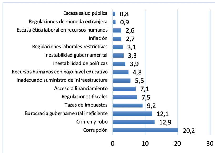
Figura 2. Factores problemáticos para hacer negocios en México.